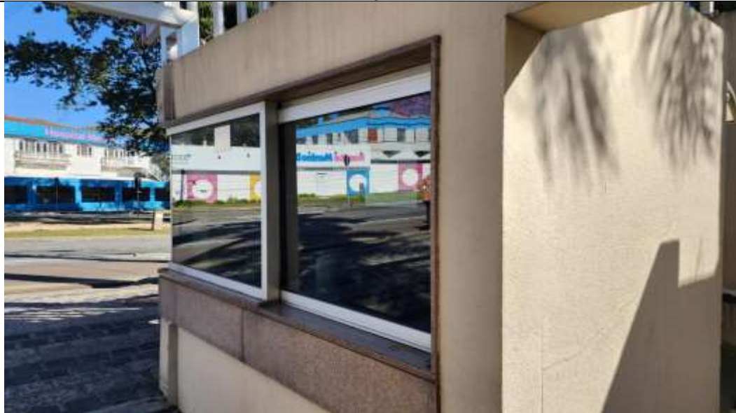
Imagem 5 – Vista frontal da guarita de segurança