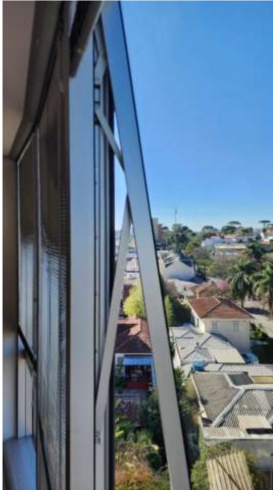
Imagem 1 – Vista lateral de janela exemplo