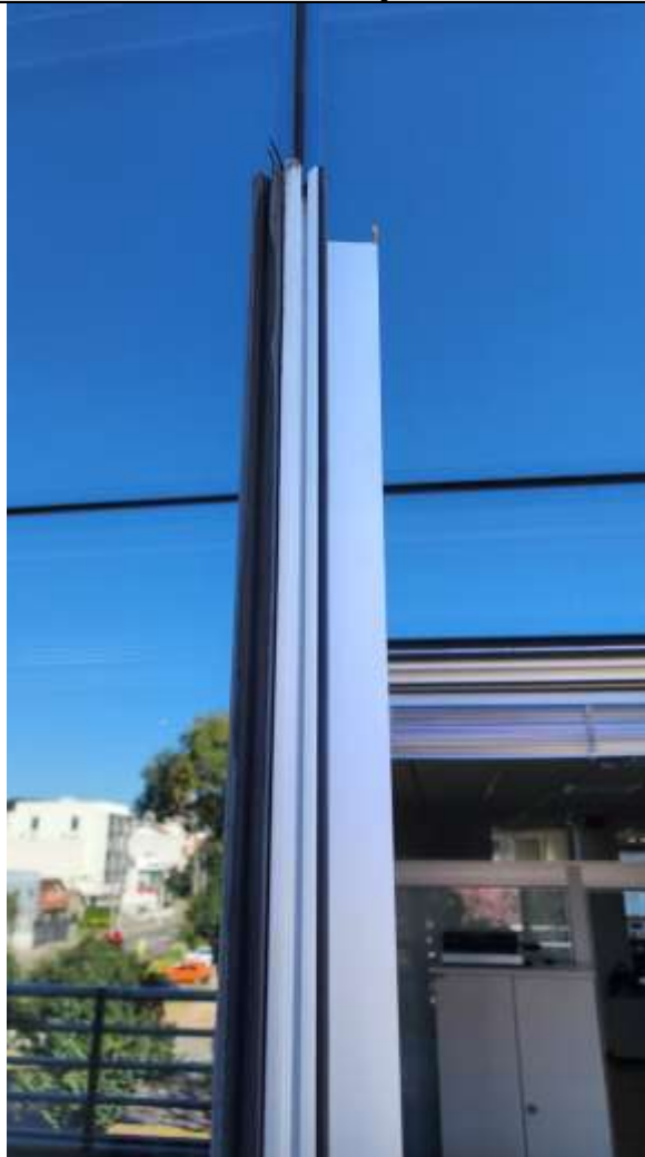
Imagem 3 – Detalhe lateral do vidro a ser substituído