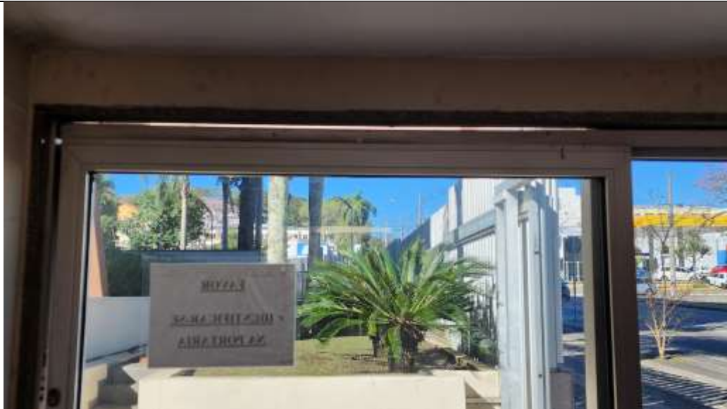
Imagem 6 – Vista interna da guarita de segurança