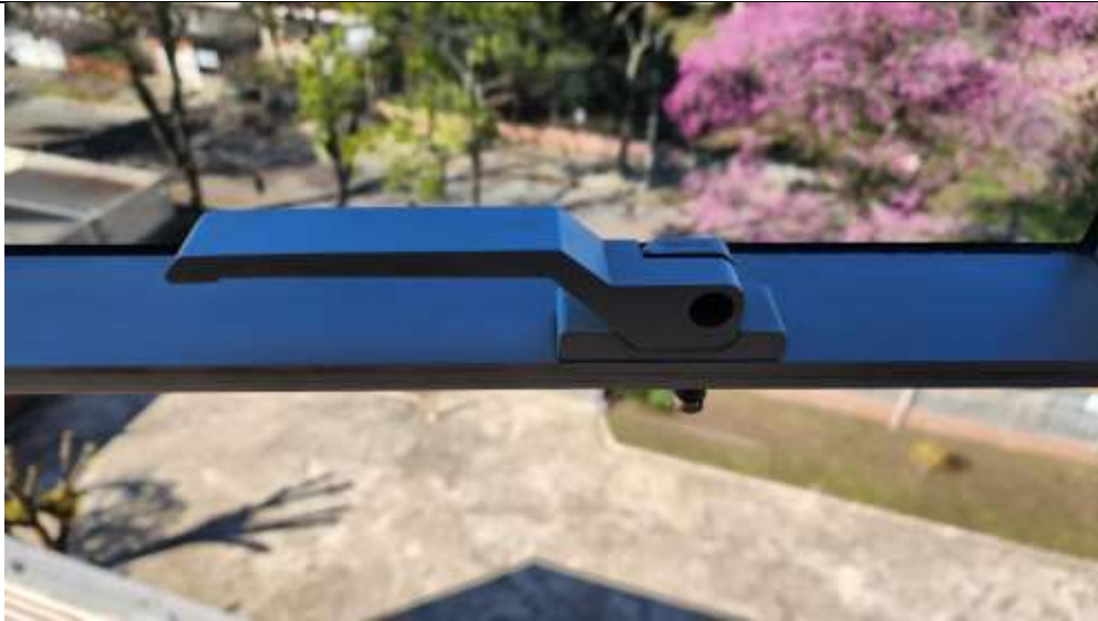
Imagem 2 – Fecho padrão instalado