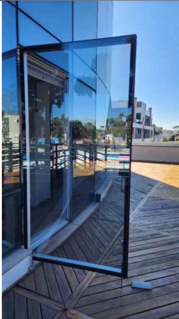
Imagem 4 – Exemplo armação e vidro similar a ser substituído